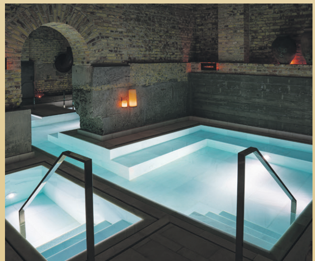
AIRE Ancient Baths Copenhagen