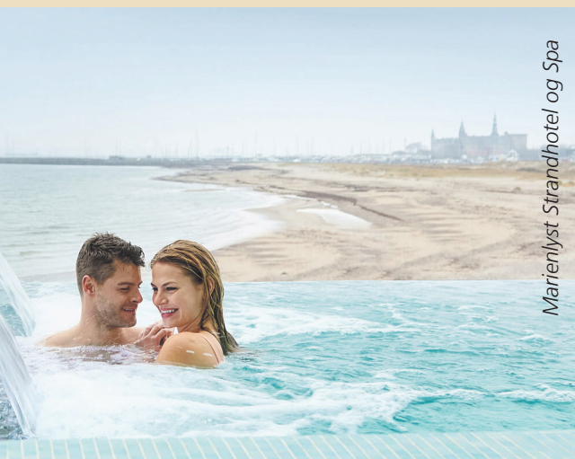
Marienlyst Strandhotel og Spa

Fjordgaarden er ikke bare nyt, det er også så bæredygtigt som muligt. Derfor har de bl.a. eget klor-anlæg, der minimerer brugen af klor og hindrer udslip i naturen. Bassiner opvarmes af fjernvarme-vekslere, og returvarmen bruges til at varme brugsvand og til rumopvarmning gennem gulvvarmeslanger. Et blødgøringsanlæg renser alt vand for kalk, så både rør og maskiner holder længere, og der ikke skal bruges skræppe rengøringsmidler. Samtidig er Fjordgaarden primært bygget i organiske, let forarbejdede materialer frem for kemiske tungtforarbejdede materialer, og alt er i videst muligt omfang certificeret med den europæiske miljøblomst.